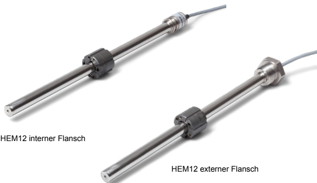
HEM12 interner Flansch